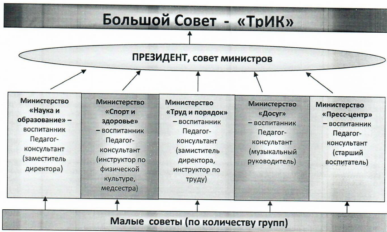
Схема модели самоуправления ГБУ «Белгородский центр развития и социализации ребёнка «Южный»